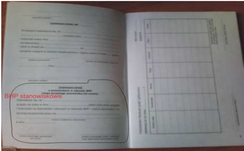
Rys 1. Strona 2 i 3.

Na stronie nr 2 w górze wpisywane są informacje z przebiegu szkolenia prowadzonego przez służby BHP zakładu pracy poświadczone pieczętą zakładu i podpisem prowadzącego szkolenie oraz szkolonego. Dolna część strony dla szkolenia stanowiskowego BHP i poświadczona pieczętą zakładu i podpisem prowadzącego szkolenie oraz szkolonego.